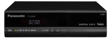
▲みるだけSTB (Panasonic TZ-LS200P)